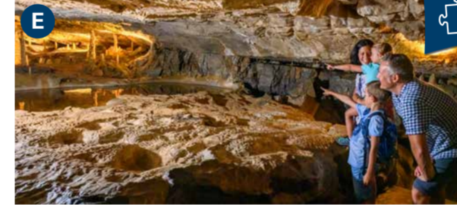
St. Beatus Caves (9 am–6 pm) Amazing dripstone cave, millions of years in the making. Open daily until 9 November.

نيدرهورن (1,950 م) مناظر خلابة، طبيعة ساحرة نقية وحياة برية مثيرة للاهتمام. مفتوح يوميًا من 1 مايو إلى 12 ديسمبر. * العرض المجمع المتاح: رحلة بالقارب مع تفرريك.