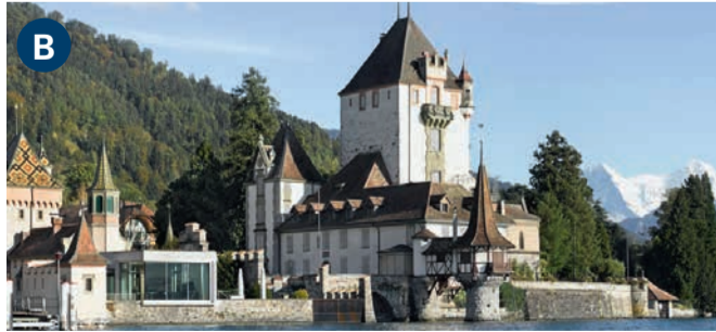
Oberhofen Castle (11 am–5 pm) Romantic castle complex with picturesque lakeside tower right next to where the boats stop. Open: Tuesday–Sunday from 11 May to 26 October

مدينة وقلعة تون هي واحدة من الوجهات السياحية الرائعة التي يمكن زيارتها للتمتع بالتاريخ والثقافة. وتعود إلى أواخر العصور الوسطى. قلعة تون تفتح أبوابها للزوار من فبراير إلى أكتوبر. عند زيارتك لقلعة تون، ستتمكن من التجول في شوارعها الضيقة واستكشاف العديد من المتاجر.