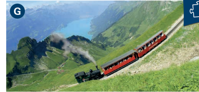
Brienz Rothorn (2,350 m) Switzerland's oldest steam-driven rack railway. Open daily from 7 June to 26 October. (Seat reservation obligation).

بريترز هناك تقليد طويل في بناء الكواخ بالخشب في هذه القرية الجميلة التي تشتهر بنحت الأخشاب، وتتواجد العديد من المنازل المذهلة من القرن الثامن عشر.