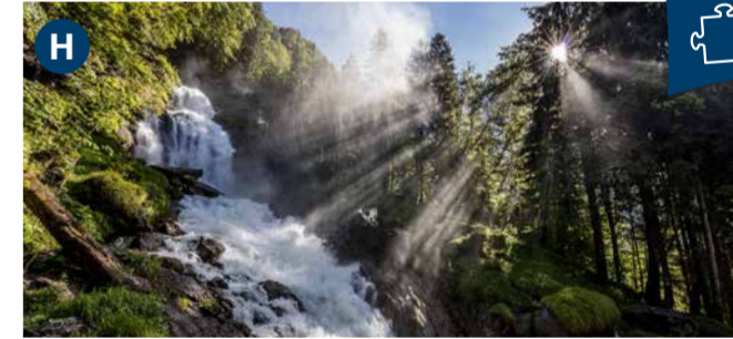
Giessbach Falls Famous waterfalls and historic Grand Hotel.

*Combination offer available: boat trip, Giessbach railway and a three-course lunch in the Grand Hotel excl. drinks. Reservation in the restaurant compulsory.