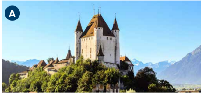
City and castle of Thun The late medieval old town with Thun Castle invites you to stroll, shop and dine. Thun Castle is open daily from April to October.

مدينة وقلعة تون هي واحدة من الوجهات السياحية الرائعة التي يمكن زيارتها للتمتع بالتاريخ والثقافة. وتعود إلى أواخر العصور الوسطى. قلعة تون تفتح أبوابها للزوار من فبراير إلى أكتوبر. عند زيارتك لقلعة تون، ستتمكن من التجول في شوارعها الضيقة واستكشاف العديد من المتاجر.