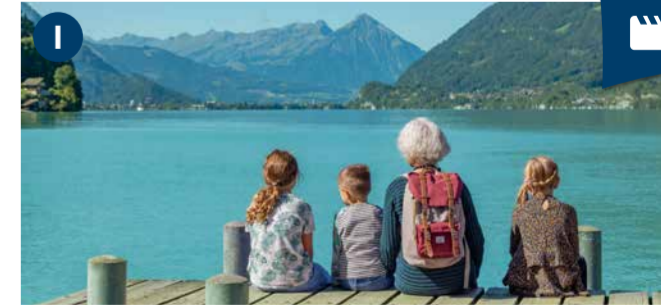
Iseltwald Nestled in a small bay on Lake Brienz, Iseltwald is a charming fishing village that offers visitors picturesque views of the surrounding mountains.

شلالات جييسباخ الشلالات الشهيرة وفندق جراند أوتيل التاريخي. * عرض التوفير المتاح حاليًا: يتضمن رحلة بالقارب وركوب خط سكة حديد جييسباخ، ووجبة غداء تتكون من ثلاثة أطباق في فندق جراند أوتيل. العرض لا يشمل المشروبات، والحجز في المطعم يعتبر إلزاميًا.