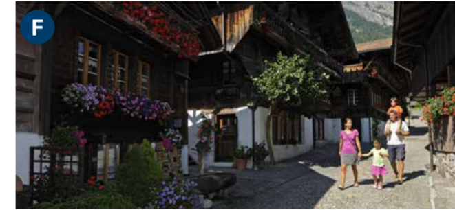
Brienz There is a long tradition of timber construction in this picture-perfect woodcarving village, and a host of spectacular 18 th -century houses.

بريترز هناك تقليد طويل في بناء الكواخ بالخشب في هذه القرية الجميلة التي تشتهر بنحت الأخشاب، وتتواجد العديد من المنازل المذهلة من القرن الثامن عشر.