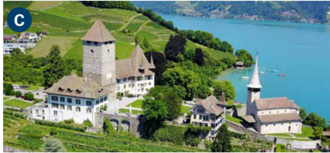
Spiez Castle and bay (2 pm–5 pm) Historic castle set in the middle of a vineyard and a beautiful bay. Open daily from 1 May to 31 October.

قلعة أوبرهوفن (11 صباحاً - 5 مساءً) مجمع قلعي رومانسي مع برج جميل يطل على البحيرة مباشرة بجوار مكان توقف القوارب. مفتوح: من الثلاثاء إلى الأحد من 11 مايو إلى 26 أكتوبر.