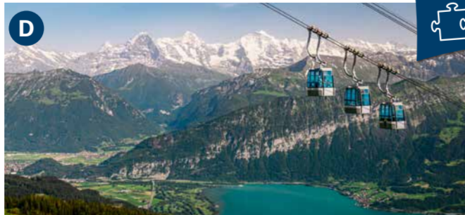
Niederhorn (1,950 m) Stunning views, unspoilt nature and fascinating local fauna. Open daily from 1 May to 12 December.

قلعة وخليج سبيز (10 صباحاً - 5 مساءً) قلعة تاريخية تقع في وسط مزرعة عنب وخليج جميل. مفتوح يوميًا من 1 مارس إلى 31 أكتوبر.